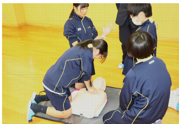
応急手当講習の様子

12月5日(火)3限目に伊勢警察署の方を講師としてお招きし、「薬物乱用防止講座」をセミナーホールにて行いました。薬物の乱用をめぐるさまざまな社会的問題やその防止のための具体的な対策について学ぶことができました。12月18日(月)に2年生が、翌19日(火)に1年生が応急手当講習を受けました。伊勢消防署の方によるご指導により、もしものときに備え、傷病者等への緊急時の対処の仕方について、体験的に学習する貴重な機会となりました。