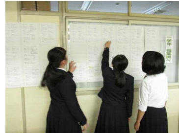
指さしながらの会話