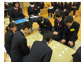
クラス対抗の様子①

昨年秋から覚えてきた百人一首の成果を発揮する場面がやってきました。6グループに分かれクラス対抗で獲得枚数を競い合う中で、先輩たちの気迫に負けず劣らずの接戦を繰り広げました。初め緊張した面持ちでしたが、時間が経つにつれ本来の実力を出すことができました。また、クラス代表として個人戦に参加した2人の活躍には、会場全体から拍手が巻き起こりました。