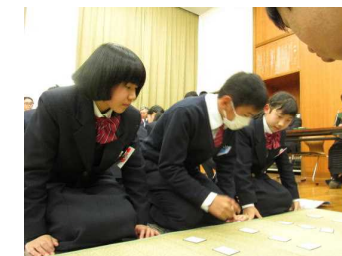
クラス対抗の様子②