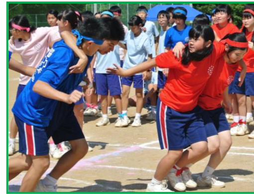
全力で走る姿に感動！