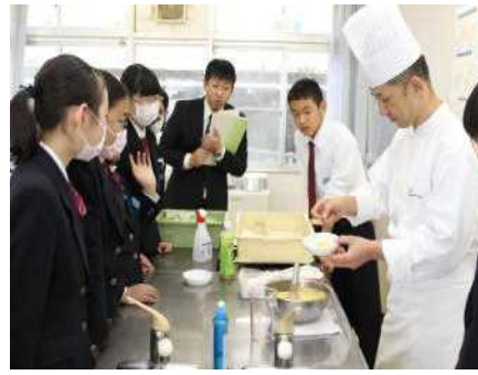
1年ビジネスパーク伊勢