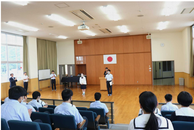
始業式における表彰の様子

例年と比べても暑い日が多く、まさに酷暑の夏休みでしたが、みなさんにとってはどのような時間を過ごすことができたでしょうか？ いよいよ昨日から2学期がスタートしました。すでに8月23日から5日間にわたる夏季課外授業の期間に入っていましたので、学習面に関しては少しずつでも生活のリズムを取り戻しつつあるところだと思います。2学期は皇中祭や体育大会などとりわけ大きな学校行事が控えています。熱中症や新型コロナウイルス感染症への対策を講じながら、みんなで協力して今学期も充実した学校生活を送っていきましょう。