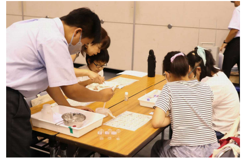
三重県私立中学校フェア2023の様子